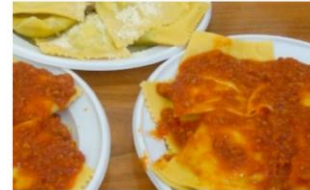
Amiatinews (Marco Conti): Roccalbegna 03/07/2020 Presentato dalla Coop "Pro Contignano" ha ricevuto un finanziamento di 45.466 Euro a fronte di un costo di 66.466 "Gente in piazza" presentato dalla cooperativa "Pro Contignano", è tra i sedici progetti delle Cooperative di Comunità finanziati con il nuovo bando della Regione Toscana di 340.000 Euro.

22 settembre. Il sindaco di Contignano ha lanciato un progetto pubblico e giovani imprenditori lanciano il settore